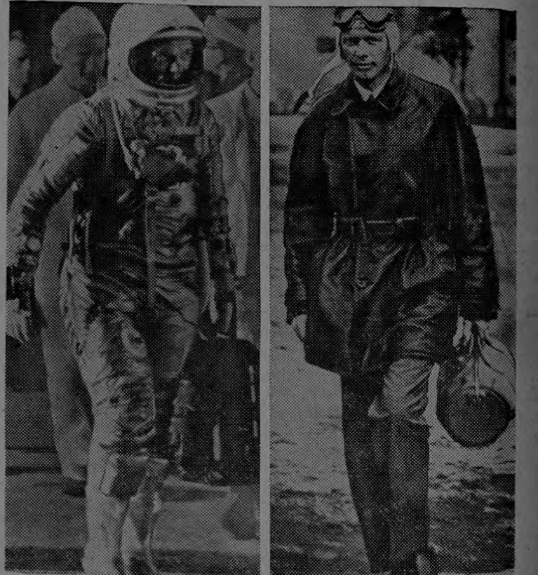
TRANSCURRIERON 35 AÑOS.—El exitoso viaje al espacio realizado por el astronauta John H. Glenn, hijo (izq.) recuerda la histórica gesta realizada por otro famoso norteamericano, quien también ganó fama mundial al realizar un vuelo en avión solo. Charles A. Lindberg (derecha) fue el primer ser humano en volar en un avión solo desde Nueva York a París. Eso ocurrió en el 1927, tres décadas y media antes que Glenn