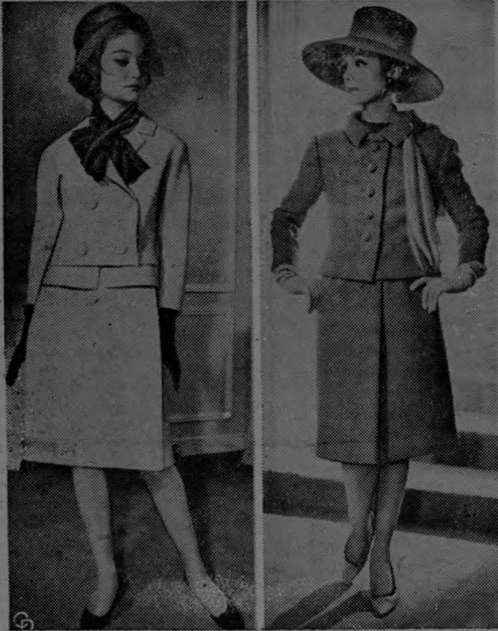
DISEÑADORES FAMOSOS. — Marc Bohan e Yves St. Laurent, el famoso diseñador que le precedió en la Casa de Dior, han organizado exhibiciones individuales en París. Bohan ha creado un modelo confeccionado en lana color amarilla (izquierda) que se distingue por la chaqueta cruzada y una falda de corte cuadrado. Complementa el modelo un sombrero de paja color azul marino y otros adornos. St. Laurent se inspiró en el estilo de "vaquero" para diseñar el vestido confeccionado en lana color frambuesa y mostaza. Dichos colores resaltan con un sombrero rojo y una estola del mismo color.